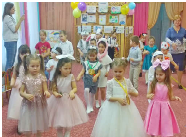
«Профсоюзный комитет», МКДОУ «Детский сад «Улыбка» п. Бабынино.

Пока работаешь с детьми – не замечаешь своего возраста, видишь результаты своего труда, хорошее, доброе отношение со стороны родителей. И самое приятное – дети тебя помнят, делятся своими секретами, просят совета, доверяют. А это дорогого стоит.